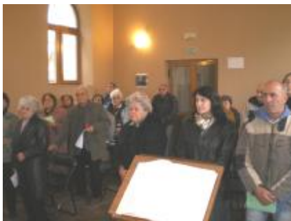
1 ноември 2012: първа Свята Евхаристия в параклиса “Бл. Евгений Босилков”