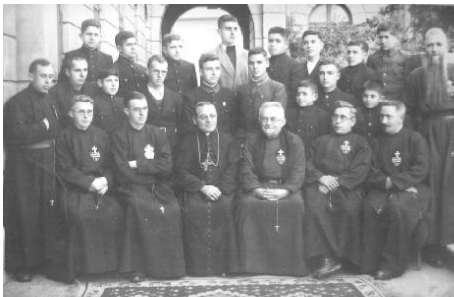
13 ноември 1947г: Бл. Евгений Босилков със свещеници от Епархията и семинаристи в Русе