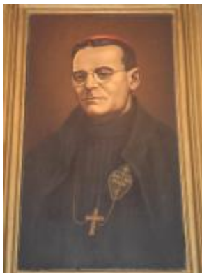
10 ноември: Литургията в светилището “Бл. Евгений” - Белене