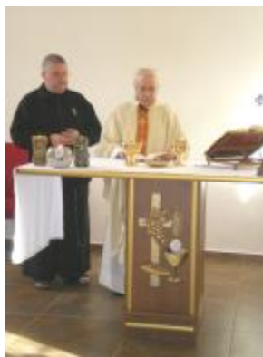
9 ноември: Литургията в параклиса “Бл. Евгений” - Русе