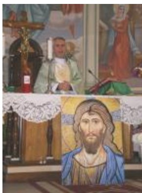
8 ноември: Литургията в Чоплеа - Букурещ - Румъния