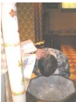
9 април Кръщението на Златка

Христос е умрял на Кръста за нас... сега живота ни зависи само от нас и как ние живеем вярата в Него.