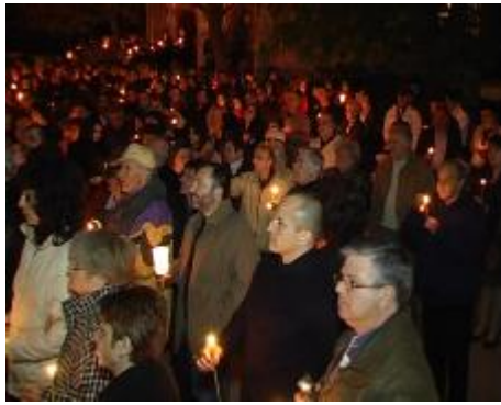
Снимките от Великден - тримата свещениците и верните