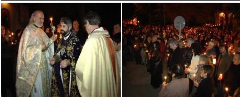
Снимките от Великден - тримата свещеници и верните

Спасението по благодат чрез вяра в Христовото дело - Юдеизмът, особено след разрушаването на храма в 70г след Христа разчита на праведни дела. Библейската гледна точка е, че в същността си хората са зли и неспособни да достигнат Божиите стандарти за праведност. Само съвършената жертва на Христос заради нас може да удовлетвори Божията справедливост и да възстанови нарушените взаимоотношения между Бог и човека.