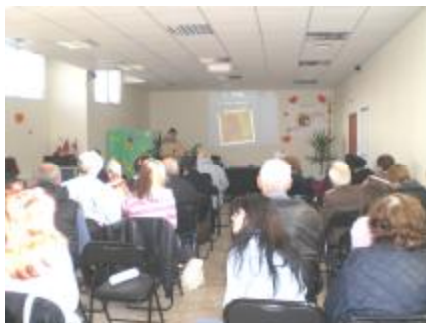
Снимки от дните на училището за молитва